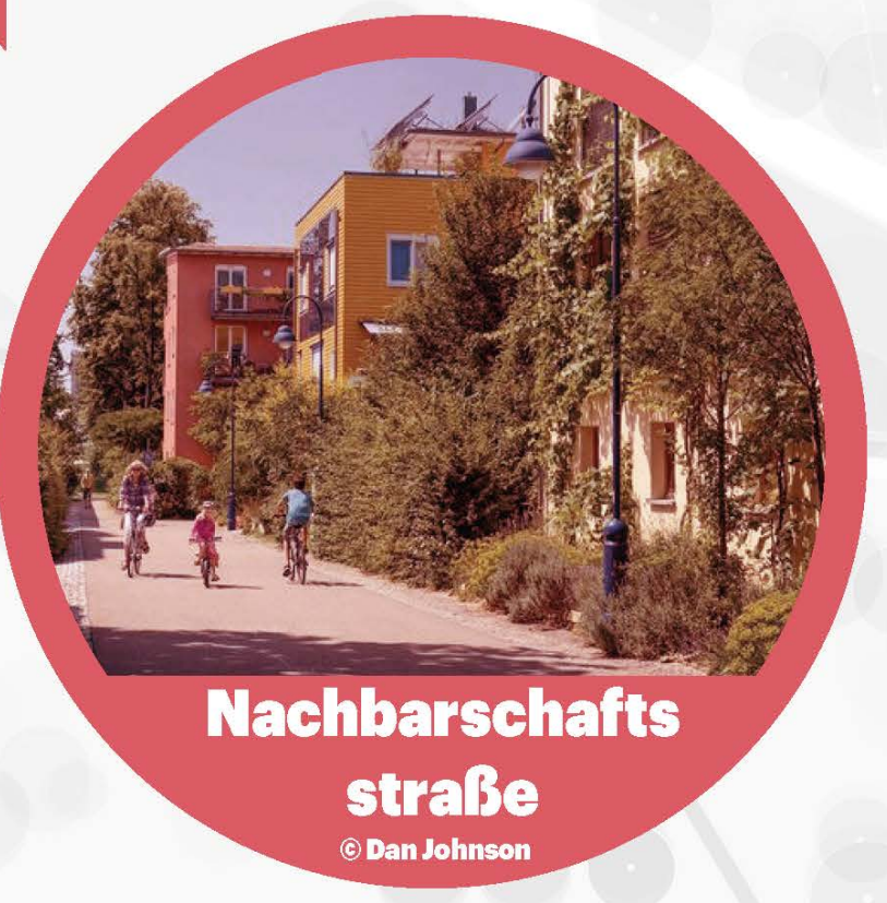
Nachbarschaftsstraße © Dan Johnson