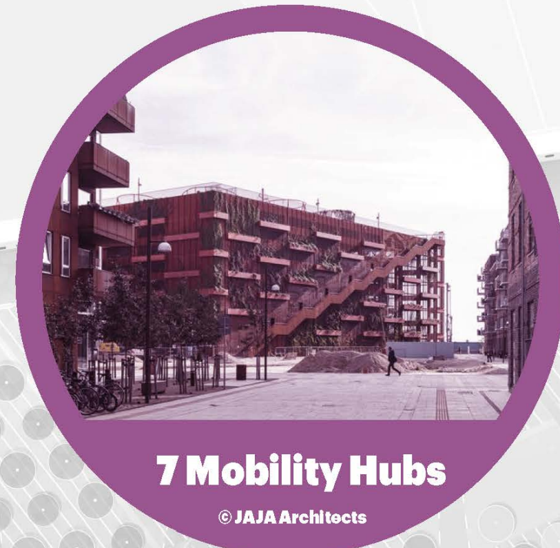
7 Mobility Hubs © JAJA Architects