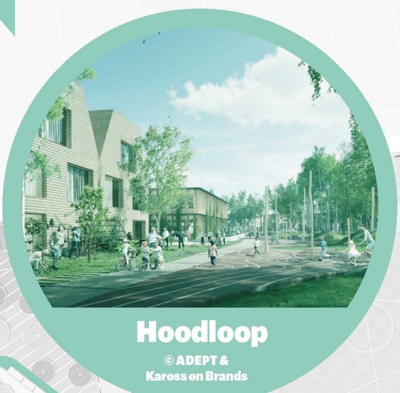
Hoodloop © ADEPT & Karres Brands