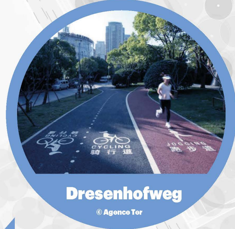
Dresenhofweg © Agence Ter