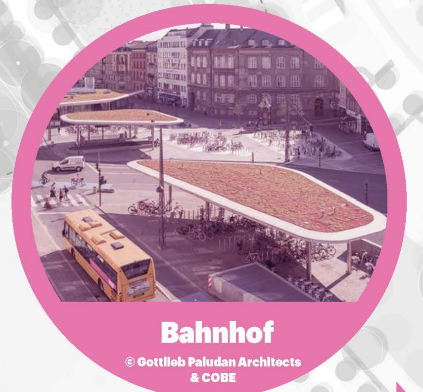
Bahnhof © Gottlieb Poldian Architects & COBE